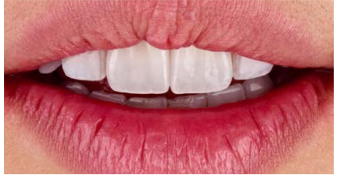
Fig. 10: l'effetto cromatico, la morfologia e la texture si armonizzavano con i denti naturali e con l'andamento del labbro.