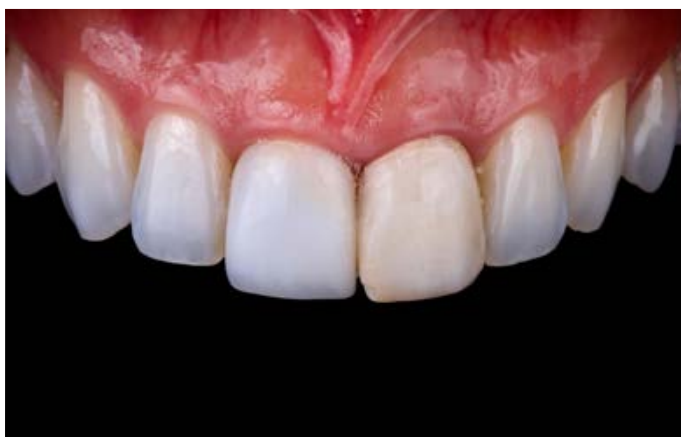
Fig. 3: i restauri avevano un aspetto spento. In particolare, non era adeguato l'effetto cromatico del dente 21.