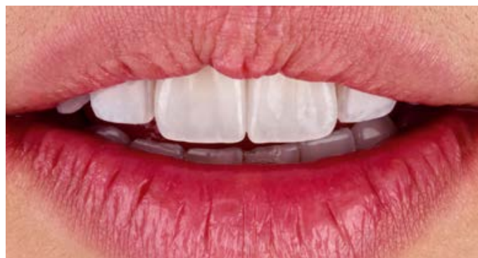
Risultato del trattamento con le nuove corone realizzate in VITABLOCS TriLuxe forte sui denti 11 e 21.