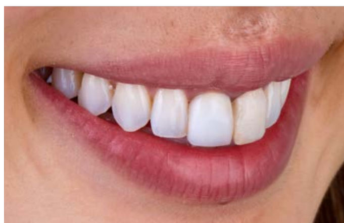
Fig. 2: le due corone sui denti 11 e 21 non si armonizzavano con la morfologia dell'arcata.