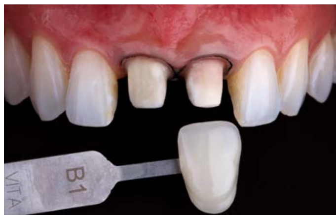
Fig. 4: la determinazione del colore dei denti è stata effettuata con VITA classical A1 - D4.