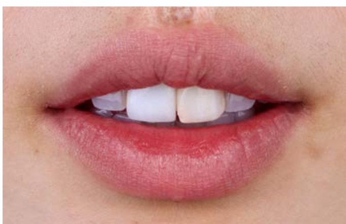
Fig. 1: la situazione di partenza, con le corone di scarsa resa estetica, sui denti 11 e 21.

adatto né al restauro del dente adiacente né ai tessuti duri dei denti residui naturali. Si è quindi deciso di trattare entrambi i denti 11 e 21 con una nuova corona nel workflow digitale. Come materiale per il restauro è stato scelto VITABLOCS TriLuxe forte, in quanto già i grezzi mostrano un aspetto simile al dente naturale, 6 sono fedeli allo standard cromatico VITA 7 e presentano un andamento cromatico naturale. 8 L'utilizzo con buoni risultati della ceramica feldspatica nel settore frontale è inoltre attestato da diversi studi clinici. 9,10