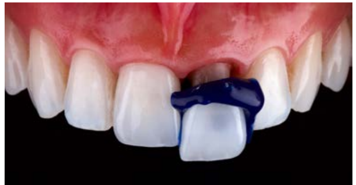
Fig. 8: il controllo dell'adattamento è stato eseguito sul lato del lume con l'ausilio di silicone blu.