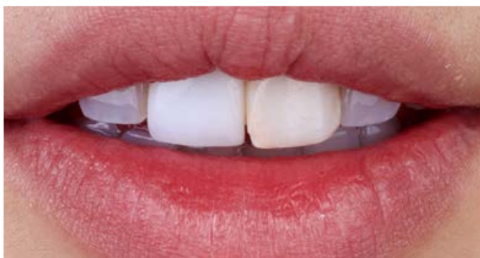
La situazione di partenza, con le corone di scarsa resa estetica, sui denti 11 e 21.