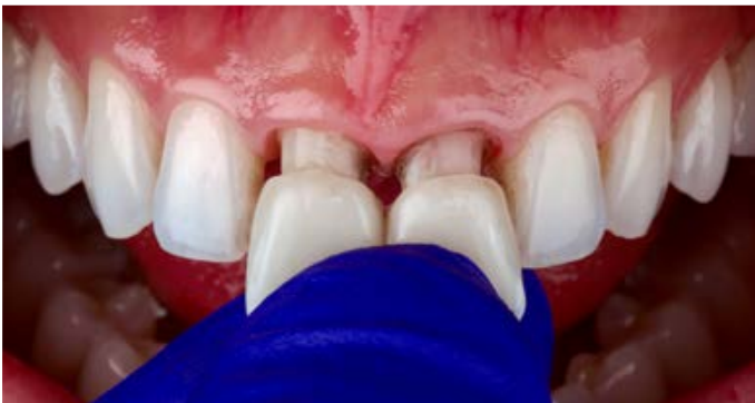
Fig. 7: dopo la finitura è stata effettuata la prova clinica delle due corone.

(Kurary Noritake, Tokio, Giappone). Le immagini finali mostrano come dai grezzi in VITABLOCS TriLuxe forte, scelti in base alle caratteristiche del paziente, sia stato possibile creare riabilitazioni assolutamente adeguate ai denti naturali. I restauri monolitici si integravano in modo armonico al centro dell'arcata superiore. Il rispetto delle regole estetiche e della morfologia naturale, accanto alla scelta del materiale corretto, è stato il fattore decisivo per la buona riuscita del trattamento.