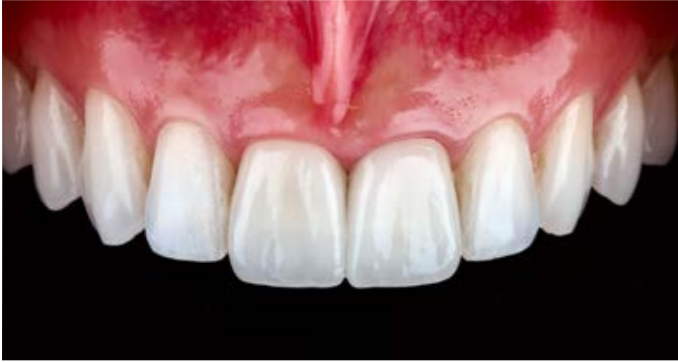
Fig. 9: dopo l'inserimento adesivo si ha un risultato altamente estetico.