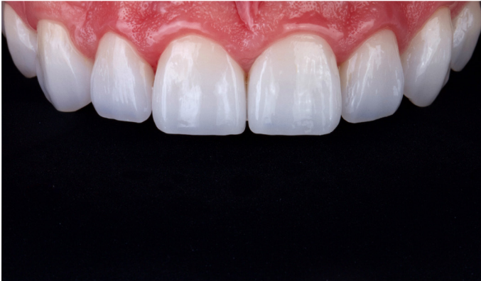
Fig. 13: El resultado de la restauración altamente estético obtenido con VITABLOCS TriLuxe forte.

cerámica de feldespato. En el proceso, VITABLOCS TriLuxe forte se reveló como una verdadera alternativa económica a la estratificación sobre muñones pirorresistentes o láminas de platino, lo cual permitirá a un grupo aún mayor de pacientes acceder a intervenciones cosméticas de este tipo.