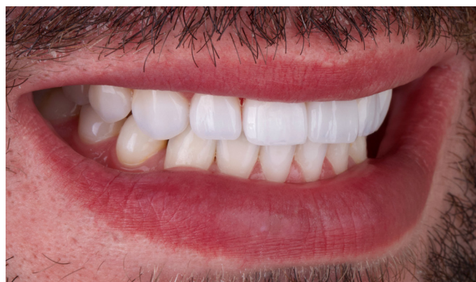
Vista lateral de la sonrisa radiante de película.