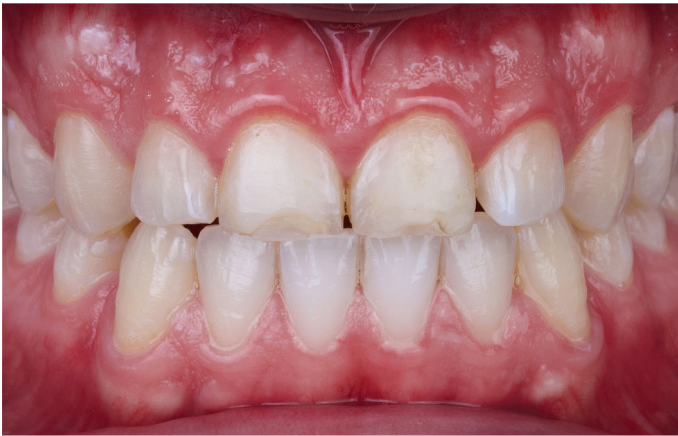
Fig. 1: Situación de partida con abrasión intensa en los dientes 11 y 21.

12 presentaba un elevado grado de abrasión. Debido a una inclinación vestibular, su antagonista 22 se situaba fuera de la oclusión dinámica y, por lo tanto, no se veía afectado. El tamaño del corredor vestibular era excesivo, debido al contorno estrecho de la arcada dentaria. Se planificaron carillas desde el diente 14 hasta el 24 para nivelar la arcada dentaria, armonizar el recorrido de los bordes incisales y establecer al mismo tiempo una situación de mordida fisiológica.