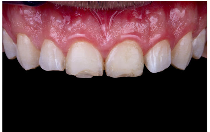
Fig. 2: Ya se había intentado en repetidas ocasiones restaurar con composite ambos incisivos centrales.