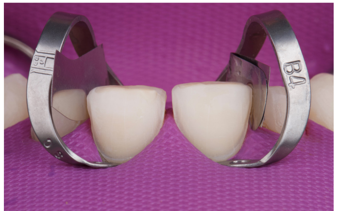
Fig. 12: Las preparaciones grabadas, antes de la aplicación del adhesivo.