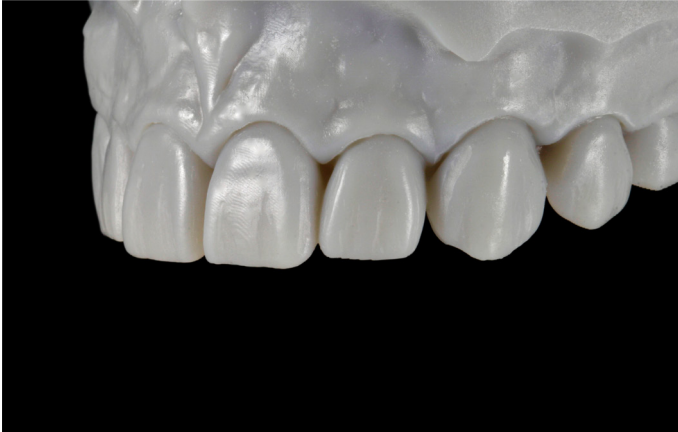
Fig. 7: Se confeccionó sobre el modelo una llave de silicona para trasladar con composite la situación intraoral deseada.