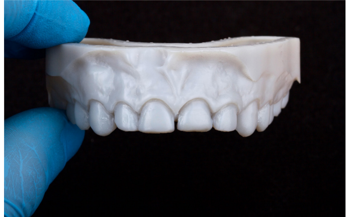
Fig. 8: Situación tras la preparación guiada, escaneo intraoral y confección aditiva de un modelo de control.