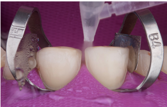
Fig. 11: Tras el grabado con ácido fosfórico, se enjuagaron con agua los dientes preparados 11 y 21.