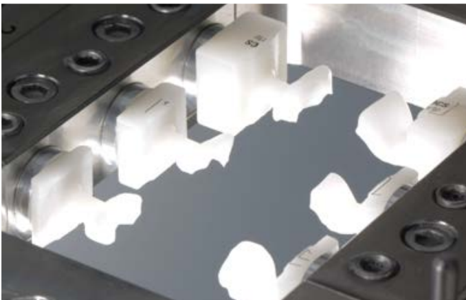
Fig. 9: Sei grezzi VITABLOCS TriLuxe forte molati nel portablocchetto.