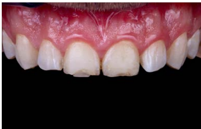
Fig. 2: In precedenza si era tentato più volte di ricostruire i due incisivi centrali con composito.