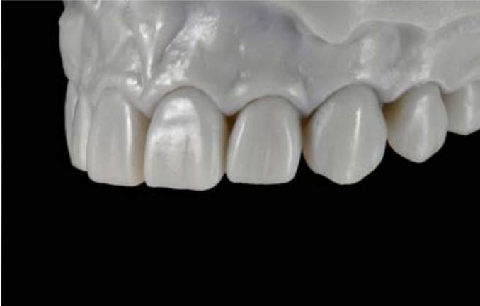
Fig. 7: Sul mock-up è stata realizzata una mascherina in silicone per poter trasferire intraoralmente la situazione desiderata con composito.