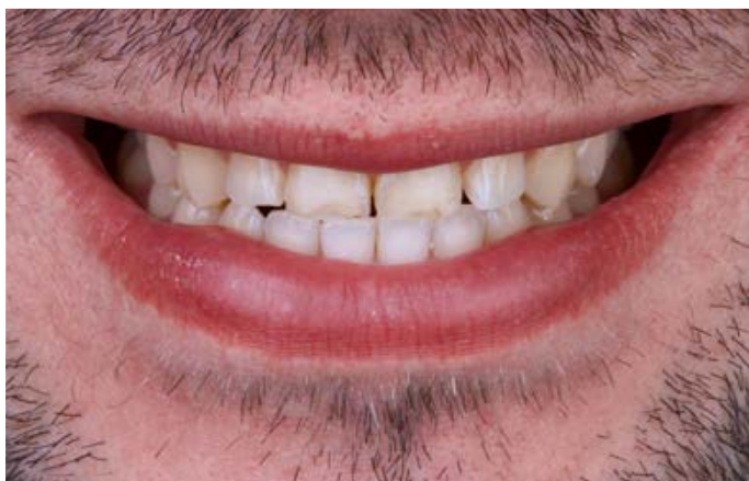
Fig. 3: I denti 11 e 21 presentavano tendenzialmente un morso testa a testa.