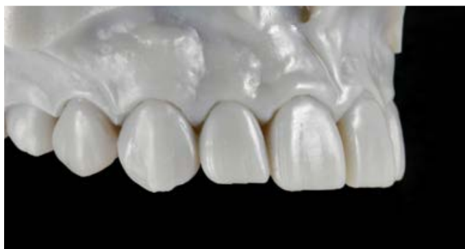
Fig. 6: Il modello mock-up additivo nella vista laterale.