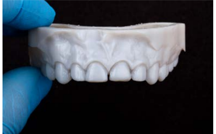
Fig. 8: La situazione dopo la preparazione guidata, la scansione intraorale e la preparazione additiva di un modello di controllo.