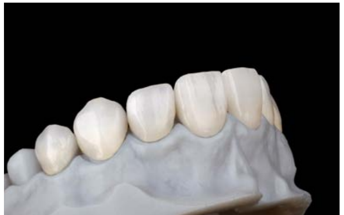
Fig. 10: Le otto faccette elaborate e levigate in ceramica feldspatica sul modello di controllo.