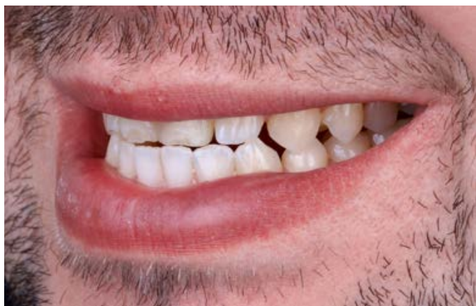
Fig. 4: L'occlusione dinamica nella vista laterale.