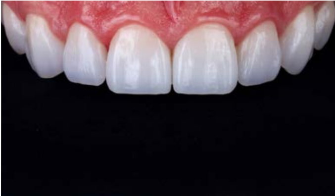
Fig. 13: Il risultato altamente estetico del restauro con VITABLOCS TriLuxe forte.

Il paziente aveva ora il sorriso da film che ricercava. La lieve diversità cromatica rispetto ai denti inferiori, che in ogni caso poteva essere eliminata con un bleaching, per il momento non costituiva un problema. Il workflow digitale aveva consentito di ottenere in breve tempo una riabilitazione estetica e funzionale con faccette in ceramica feldspatica.