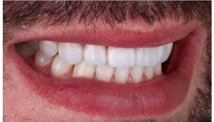
Fig. 14: Il sorriso luminoso da film nella vista laterale.

VITABLOCS TriLuxe forte si è rivelato quindi un'alternativa veramente economica alla stratificazione su monconi in materiale refrattario o fogli di platino, in modo da rendere questi interventi cosmetici accessibili a un maggior numero di pazienti.