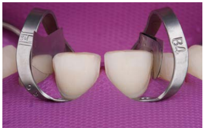
Fig. 12: Le preparazioni mordenzate prima dell'applicazione dell'adesivo.