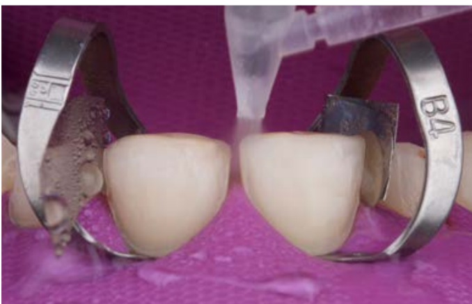
Fig. 11: Dopo la mordenzatura con acido fosforico, i denti 11 e 21 sono stati sciacquati con acqua.