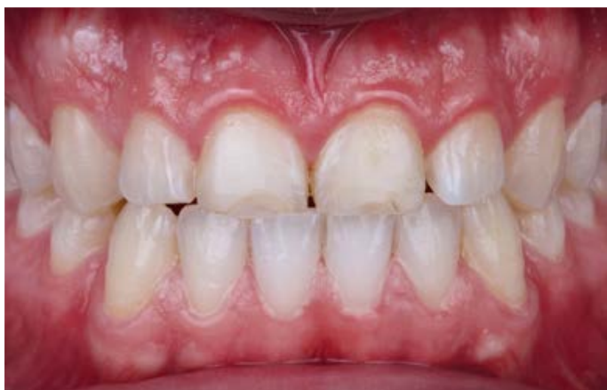
Fig. 1: La situazione di partenza con i denti 11 e 21 fortemente abrasati.

mentre il dente opposto 22 si trovava, a causa dell'inclinazione vestibolare, al di fuori dell'occlusione dinamica e pertanto non era interessato. Il corridoio buccale si mostrava di dimensioni eccessive a causa dell'andamento sottile dell'arcata dentale. Sono state progettate faccette dal dente 14 al 24 in modo da livellare l'arcata, armonizzare l'andamento incisale e allo stesso tempo stabilire un morso fisiologico.