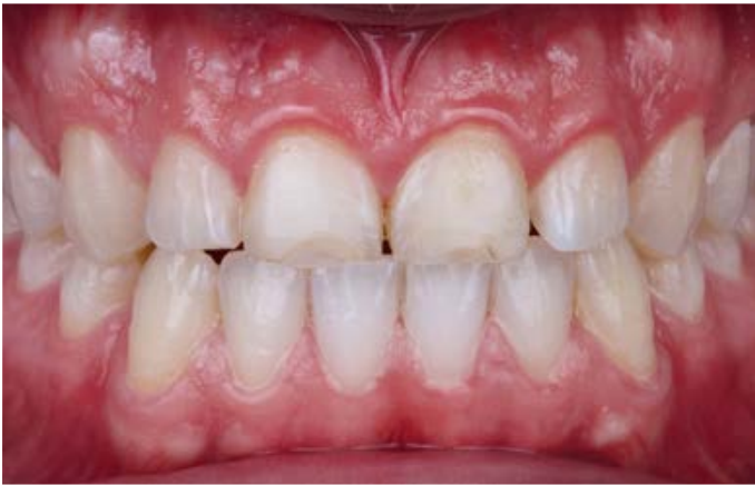
III. 1 : situation initiale avec les 11 et 21 fortement abrasées.

était également nettement abrasée. Sa vis-à-vis 22 se trouvait en dehors de l'occlusion dynamique en raison d'une bascule vestibulaire et n'était donc pas concernée. Le corridor vestibulaire s'est avéré trop grand en raison de l'étroitesse de l'arcade dentaire. Des facettes ont été planifiées de 14 à 24 afin de niveler l'arcade dentaire, d'harmoniser le tracé du bord incisif et d'établir en même temps une situation d'occlusion physiologique.