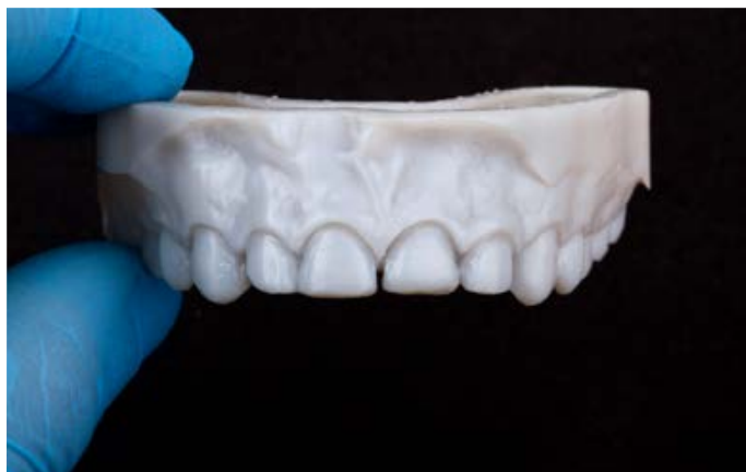
III. 8 : situation après préparation guidée, scannage intra-oral et fabrication additive d'un modèle de contrôle.