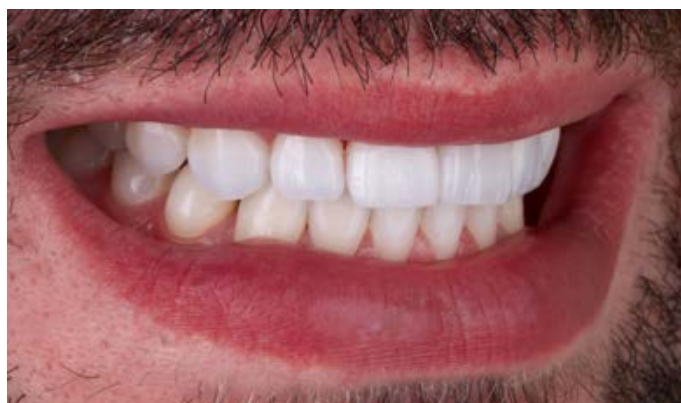
Le sourire clair, digne d'un film, vu latéralement.