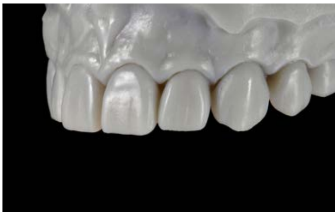
III. 7 : une clé en silicone a été fabriquée sur la maquette afin de transférer la situation théorique en intra-oral à l'aide de résine composite.