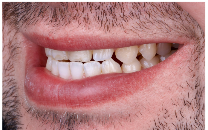
Abb. 4: Die dynamische Okklusion in Protrusion in der Ansicht von lateral.