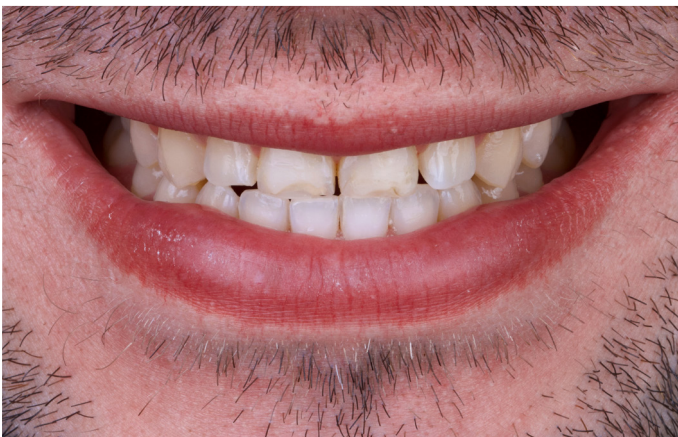
Abb. 3: Die Zähne 11 und 21 befanden sich tendenziell im Kopfbiss.