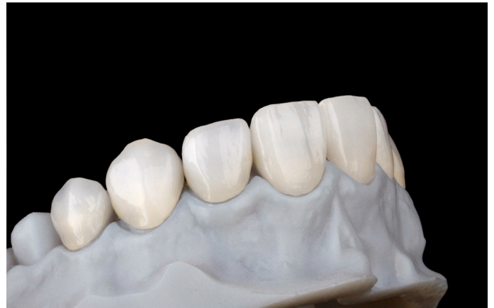
Abb. 10: Die acht ausgearbeiteten und polierten feldspatkeramischen Veneers auf dem Kontrollmodell.