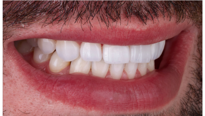
Abb. 14: Das helle, filmreife Lächeln in der Ansicht von lateral.