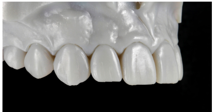
Abb. 6: Das additive Mock-up-Modell in der Ansicht von lateral.